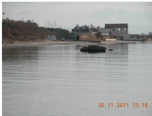
Foto 19 vista dalla foce