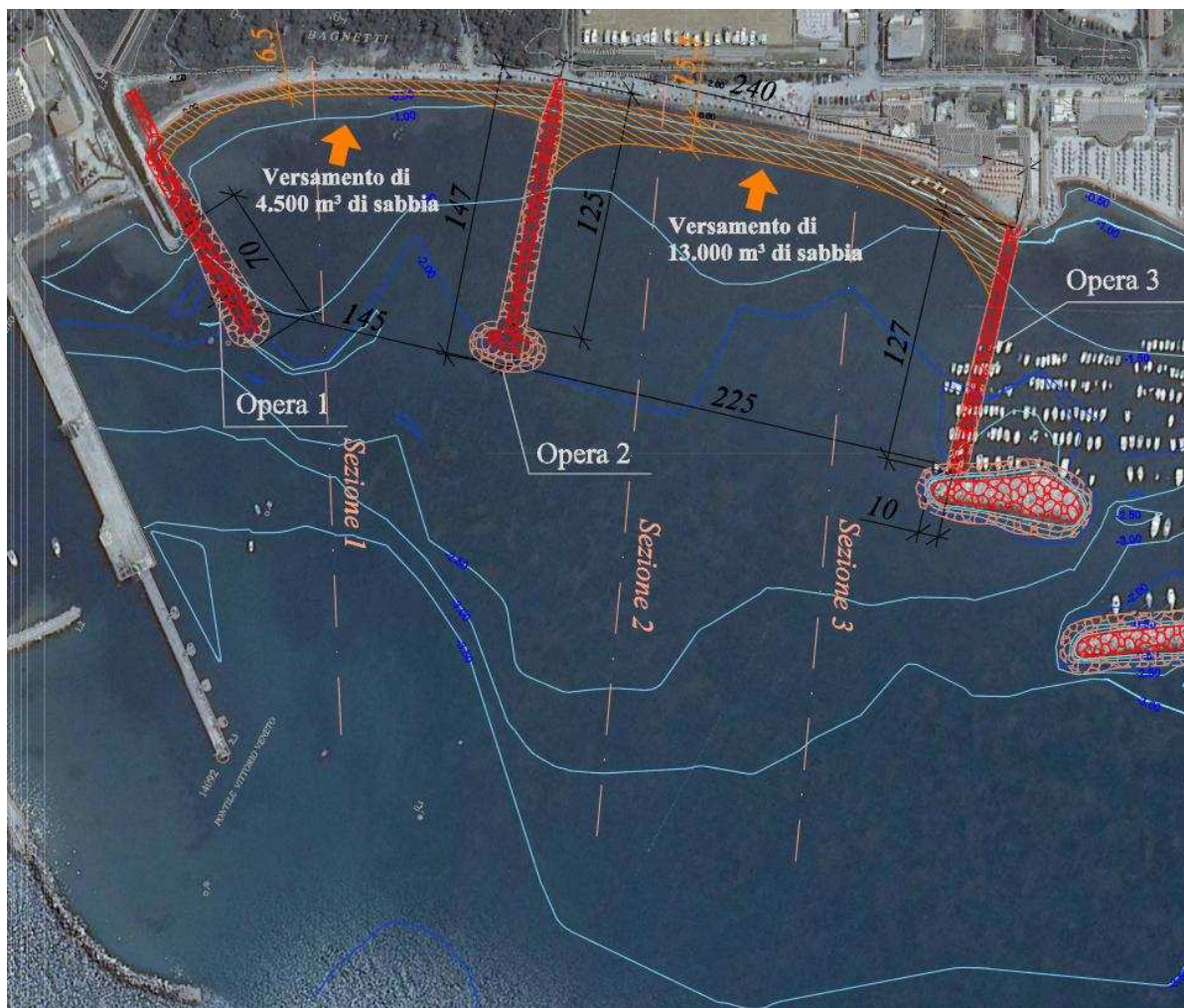
Estratto dalla Tav. 3 "Planimetria stato di progetto"