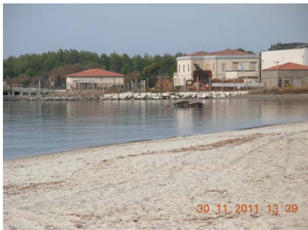
Foto 18 vista dalla spiaggia