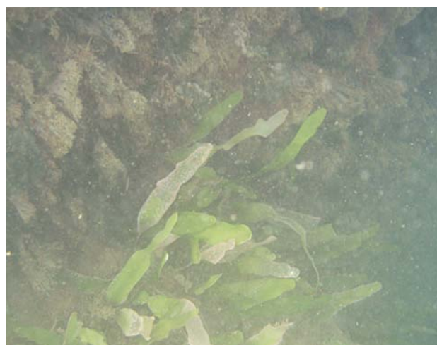
Foto 21 vista subacquea della struttura