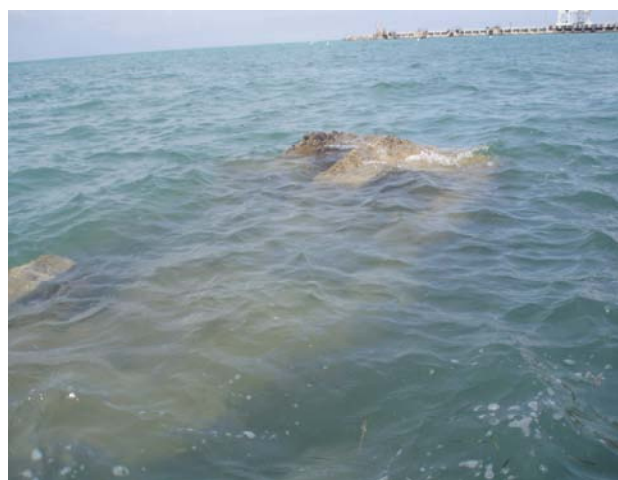
Foto 23 vista dalla spiaggia